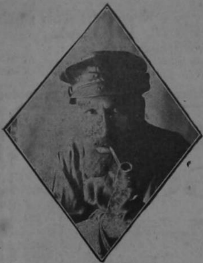
CAMPA en «La Mujer de Claudio»