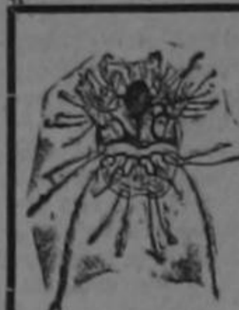
MACHO AUMENTO: 600 VECES

COMBATA ESA PICAZON O RASQUINA CON EL FAMOSO ACEITE VERDE