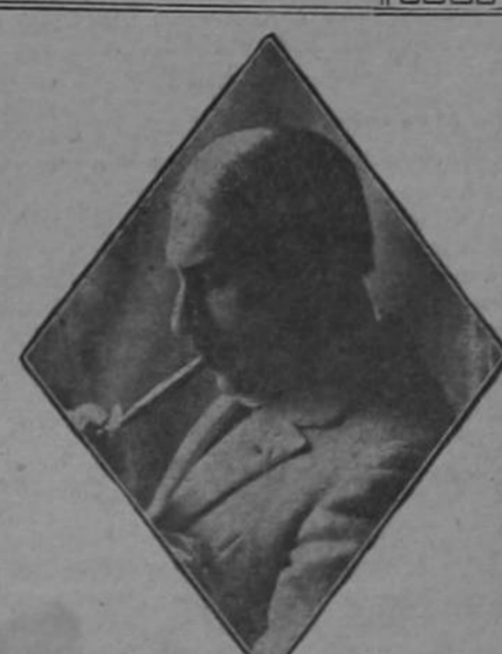
CAMPA en un personaje de Oscar Wilde