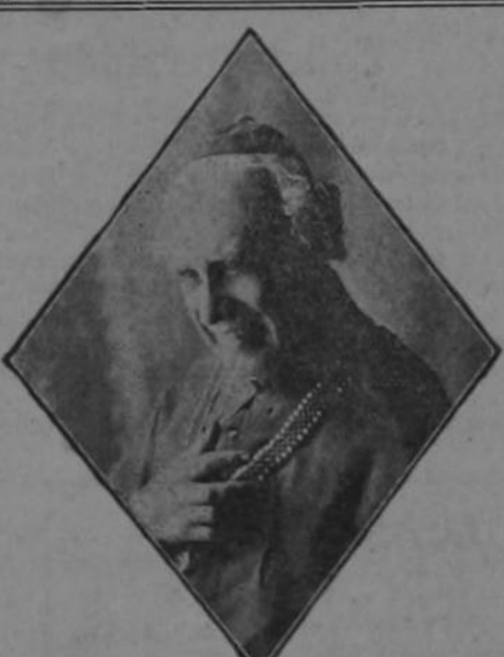
CAMPA en el «Cardenal de Maurras»